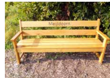
🏠 Zitbank Meijldoorn.

Het is weliswaar monnikenwerk maar voor de Schijndelse gemeenschap is het zeer de moeite waard, zeker als je bedenkt dat de groep voortdurend bouwstenen aandraagt voor een variatie aan publicaties, hetzij in artikel- of boekvorm. We hebben een vaste archiefdag op de woensdagen van 9.00-12.00 uur op het BHIC. Veel bouwstenen hebben de laatste jaren ook hun vruchten afgeworpen in het kader van heemkundige activiteiten als het ontwerpen van 28 attentiestenen van veelal verdwenen gebouwen die her en der in het plaveisel zijn ingemetseld, 34 historisch getinte spoorplaten die gelegd zijn binnen een gedeelte van de oude tramrails door de Hoofdstraat, teksten voor enkele dvd's zoals die rond de verfilming van Schijndelse volksverhaal over Sleutjesspook en van 'de Goede Moordenaar' met een terugblik op de periode tussen 1898-1936 toen er een tram door het centrum reed. Ook zijn teksten voor informatiebordjes aangeleverd bij de serie zitbanken in het buitengebied van het dorp met hun middeleeuwse veldnamen. Een historische werkgroep die er dus echt toe doet en binnen een heemkundekring van onschatbare waarde is.