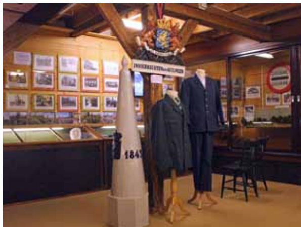
Overzicht van de tentoonstelling.

De taal veranderde, hier Brabants Nederlands en daar Kempisch Nederlands; er ontstond verschil in klederdracht, in wegen, in huizen, de wetgeving veranderde. Beide gemeenschappen groeiden uit elkaar, er ontstond een scheiding van landen en van geesten.