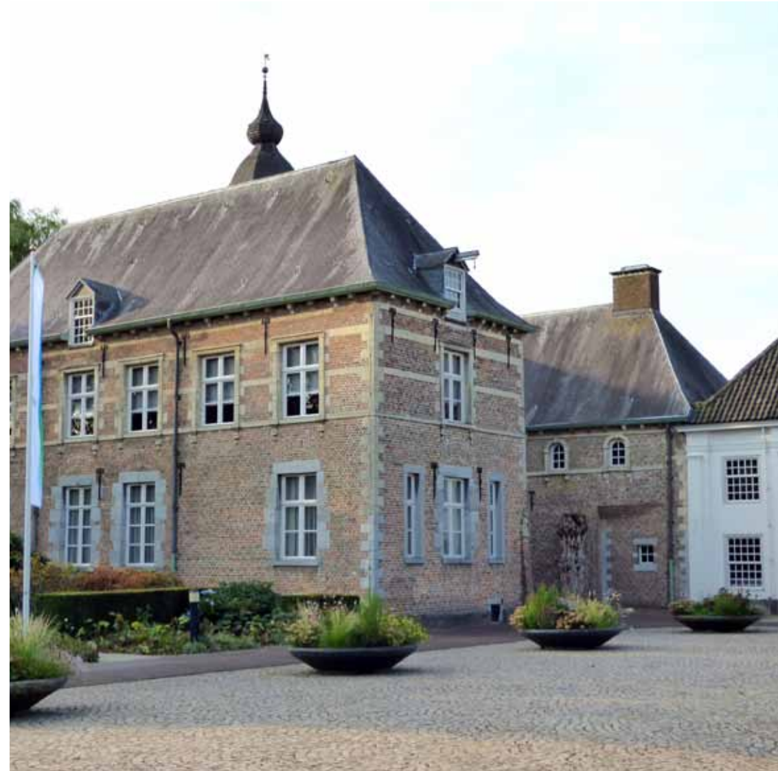
▼ Slot Dommelrode.

Jammer dat de gidsen niet meer tijd ter beschikking hadden om hun uitgebreide kennis over te brengen. Zeker met zulk aandachtig gehoor. ▶