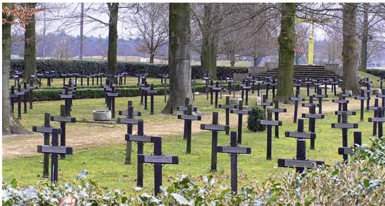
➤ Interreligieus ereveld Teteringen.