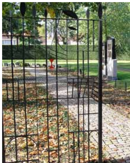
▼ Kruisheren op algemene begraafplaats Uden.

Er zijn ook mengvormen. De Kruisheren bijvoorbeeld hebben voor hun overleden medebroeders een afgesloten deel op de algemene begraafplaats in Uden; naast een 'echte' kloosterbegraafplaats nabij het Sint Aegtenklooster in Sint Agatha bij Cuijk. Kloosterkerkhoven bij door de oorspronkelijke bewoners verlaten kloosters, zoals dat van de Benedictijnenabdij in Heeswijk en dat van de Broeders van Oudenbosch (Saint Louis), worden door de nieuwe eigenaren conform gemaakte afspraken gerespecteerd. Simpelert ligt dat bij kerkhoven van nog in gebruik zijnde kloosters, zoals dat van de abdij van