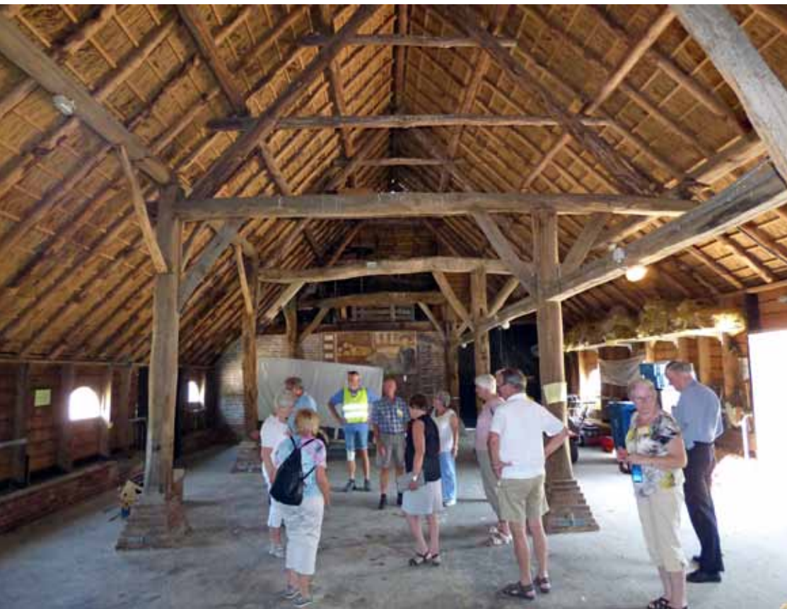
» De Schaauskooi Schijndel.