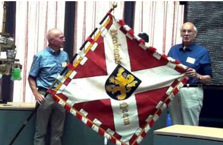
◀ Overdracht van het vaandel.

"VBC Brabantse Heemdagen ten deze handelend namens de Stichting Brabants Heem draagt hierbij met alle respect het vaandel over aan de kringen Erthepe Vehchele, Schijndel en De Oude vrijheid verenigd in Meierijstad. Daarmede domicilie kiezend in dit deel van Brabant om gedurende de heemdagen van 2018 kond te doen van woord, beeld en geschrift harer gebieden onder het motto "STROOMOPWAARTS Erfgoed Meierijstad."