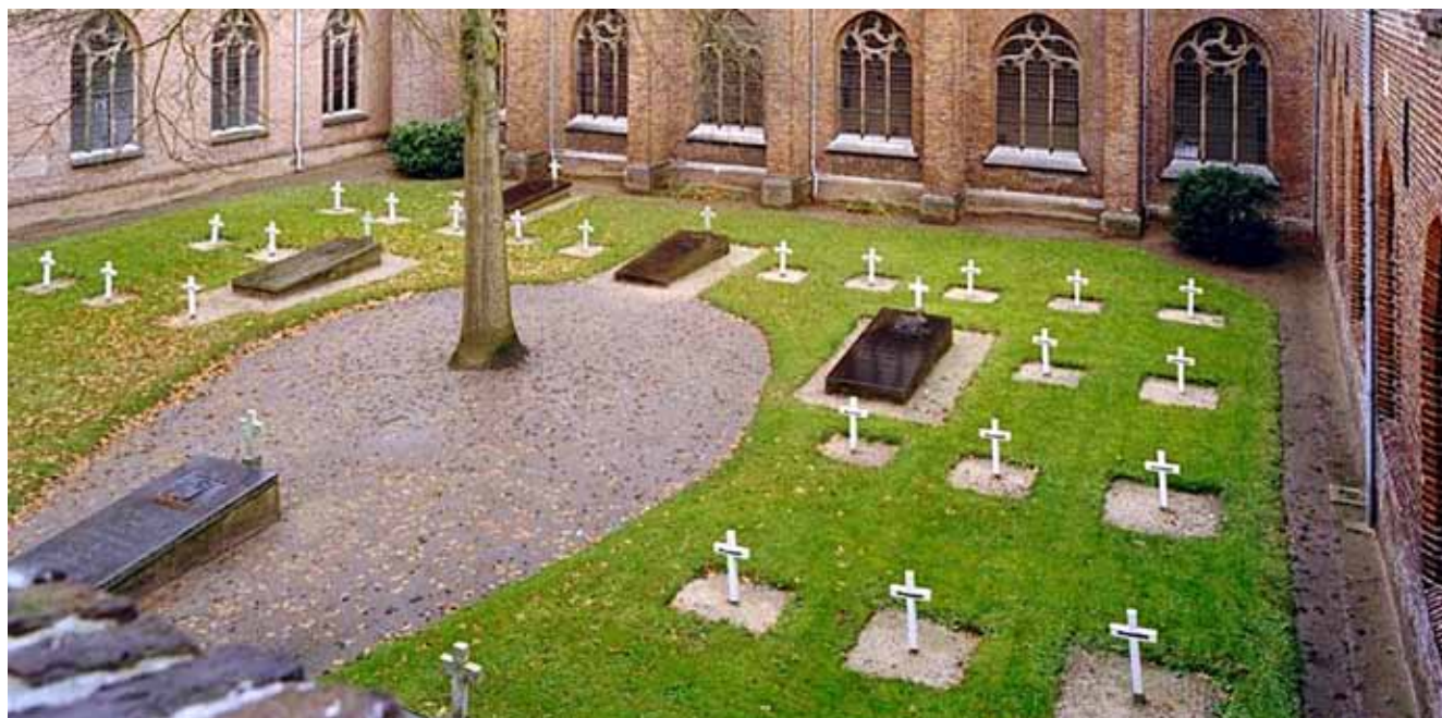
➤ Kruisherenkerkhof bij klooster Sint Aegten te Sint Agatha.

Een rondgang leert dat in elk geval in Noord-Brabant de religieuze erevelden, vaak nog (?) niet vrij toegankelijk voor publiek en verstopt binnen (voormalige) kloostercomplexen en bijbehorende tuinen, er piekfijn bij liggen. Neem Tilburg. In de binnenstad tref je daar op loopafstand van elkaar vier kloosterkerkhoven: twee grote en twee kleine. De Tilburgse Zusters van Liefde beheren hun lommerrijke mammoetkerkhof aan de Oude Dijk, pal in het centrum van de stad, met grote zorgvuldigheid. Dat geldt ook voor het ereveld van de Zusters van Notre Dame aan de Bredaseweg. Ingesloten door nieuwbouwwoningen ligt, eveneens aan de Bredaseweg, het wat kleinere kerkhof van de Missionarissen van het Heilig Hart (MSC) en wel op het vroegere terrein van hun Missiehuis aan de Bredaseweg, inmiddels omgedoopt tot Rooi Hartenplein. De MSC-ers hebben ook nog een kerkhof in het Limburgse Stein. Aan de Korvelseweg in Tilburg koesteren de Minderbroeders Kapucijnen hun inspannend kloosterkerkhof. Hun laatste, want al hun andere kloosterkerkhoven (Breda, Eindhoven, Helmond, Den Bosch etc.) zijn al ontmanteld en overgeplaatst naar de Nationale Herdenkingsplaats van de Nederlandse Kapucijnen te Velp bij Grave. Opvallend is dat de onderwijscongregatie