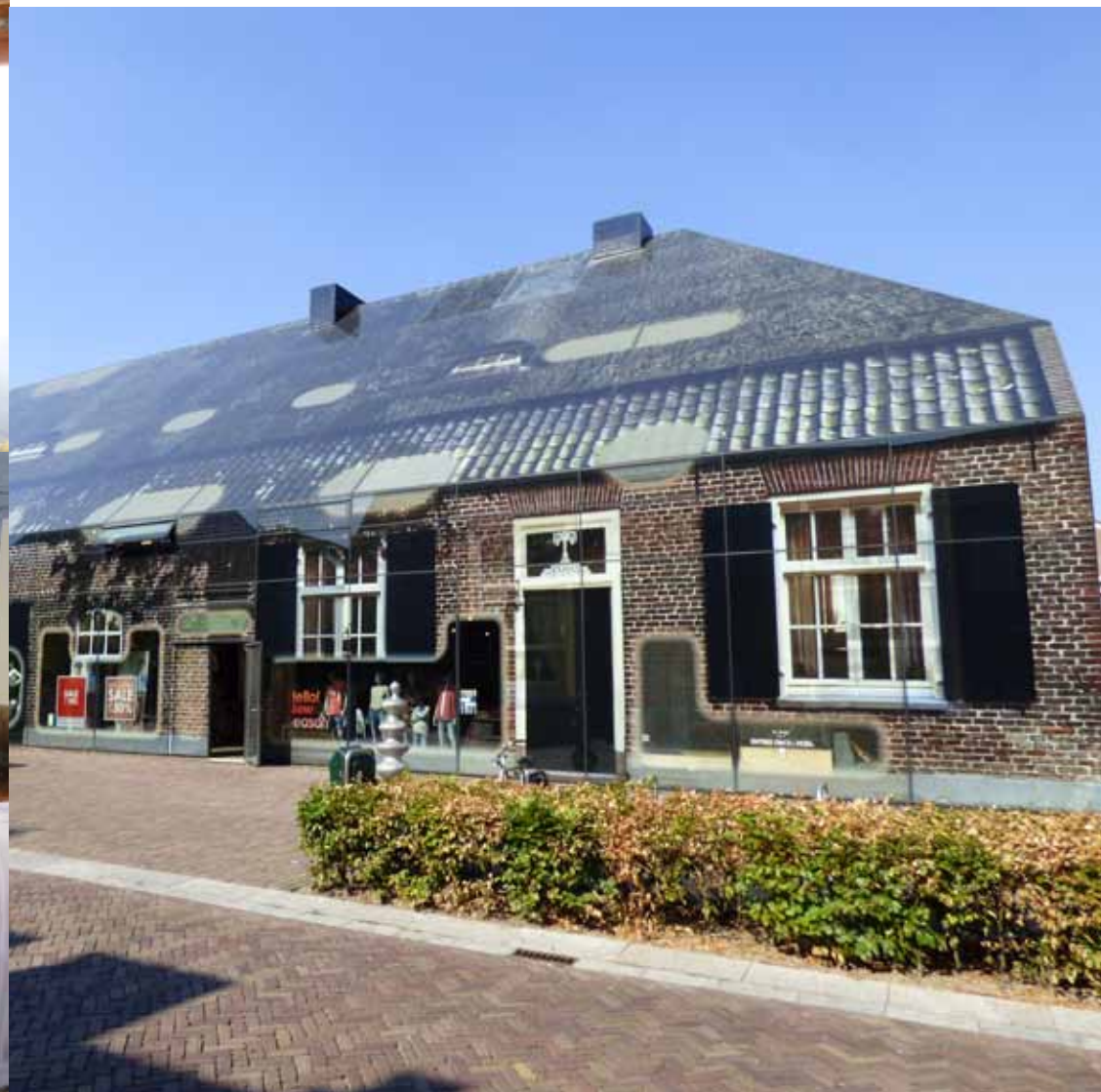
» De Glazen Boerderij op de Markt in Schijndel.

In het Jan Heestershuis waren diverse kunstwerken van bekende en minder bekende schilders tentoongesteld. Ook de tijdelijke tentoonstelling “Boeren, Burgers en Buitenlui”, sprak de bezoekers aan. De oorspronkelijke woning met zijn authentieke inboedel was duidelijk niet opgewassen tegen de hoge buitentemperatuur en daarom werd de rondleiding ingekort. Bij de Glazen Boerderij op de Markt werden veel vragen gesteld omdat dit een bijzonder fotografisch en technisch hoogstandje is. »