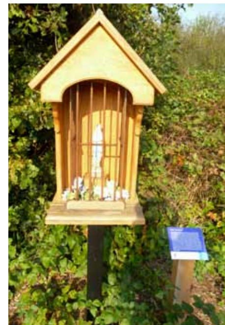
Stokkappelletje en informatiepaneeltje.

In de jaren '40 van de vorige eeuw werd in Schijndel al een begin gemaakt met de oprichting van heemkundekring Hertog Jan II en sloot een kleine groep belangstellenden zich aan ter behartiging van kunst, cultuur, historie en dialect. Het was toentertijd binnen Brabant een soort golfbeweging en er ontstond een sneeuwbaaleffect, de ene na de andere kring werd opgericht, wat heden ten dage is uitgemond in zo'n kleine 130 heemkundekringen. De koepelorganisatie Brabants Heem begeleidde al die kringen naast andere Brabantse instanties die de zorg voor het Brabants erfgoed als hoofddoel hebben.