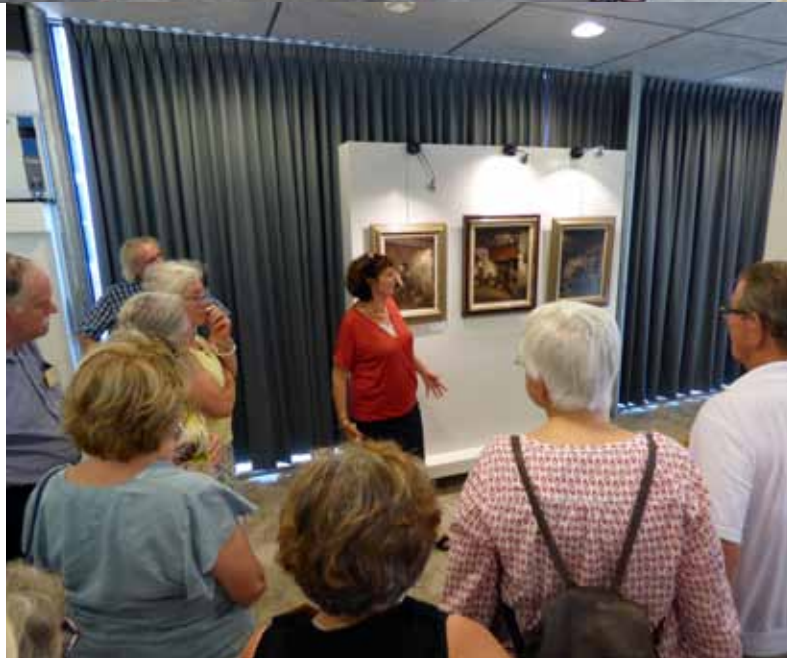
» Museum Jan Heestershuis Schijndel.

In het Jan Heestershuis waren diverse kunstwerken van bekende en minder bekende schilders tentoongesteld. Ook de tijdelijke tentoonstelling “Boeren, Burgers en Buitenlui”, sprak de bezoekers aan. De oorspronkelijke woning met zijn authentieke inboedel was duidelijk niet opgewassen tegen de hoge buitentemperatuur en daarom werd de rondleiding ingekort. Bij de Glazen Boerderij op de Markt werden veel vragen gesteld omdat dit een bijzonder fotografisch en technisch hoogstandje is. »