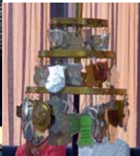
▼ De schellenboom.

Vervolgens bevestigde de organisator van de heemdagen 2017 Cranendonck het schild van hun kring aan de schellenboom.