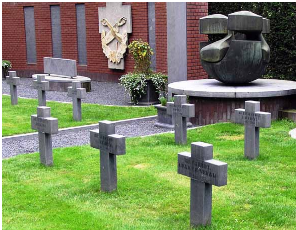
▲ Monumentaal kerkhof Broeders van Boekel naast parochiekerkhof Handel.

Berne (Norbertijnen) in Heeswijk. In zowat alle gevallen liggen de kloosterlingen begraven op terreinen die eigendom van hun kloosters of van door hen opgerichte stichtingen zijn. Dat biedt de garantie dat deze graven in beginsel niet na verloop van tijd automatisch geruimd worden.