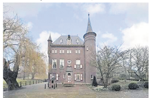
Kasteel Huis van Malsen, Well (Gelderland).

land wil voegen. Het keizerlijk hof wordt bericht dat neef Floris door 'die Van Cuijk' is vermoord