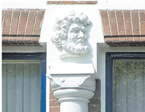
Floris de Zwaarte van Holland / Tolboom, Mariaplaats Utrecht.

behoud van zijn eigen Malsense merletten, de oude familiebezittingen, rechten en belangen in de Tielervwaard. Vandaar de betrokkenheid van zijn weduwe bij de stichting van Mariënweerd (1129).