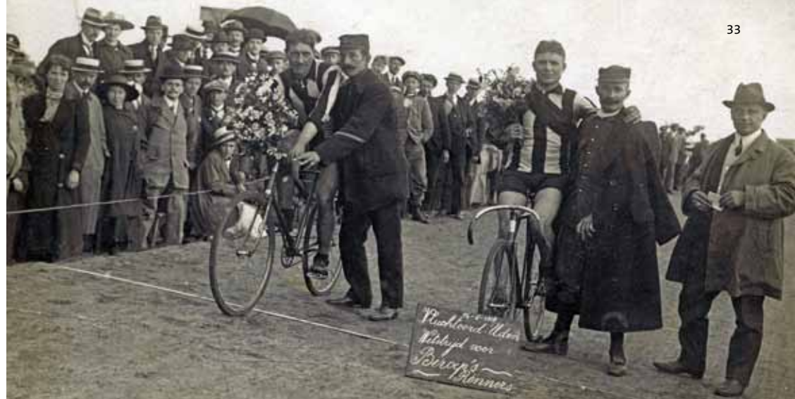
♣ Wielervedstrijd in juni 1918 in Vluchtoord.

De officiële titel van het boek is: "Van Vluchtoord Uden terug naar een eenzame, kale hei". Het eerste boek "Van heidegrond tot Vluchtoord Uden" behandelde vooral de periode 1914 – 1915, toen er in Uden in korte tijd een vluchtelingenkamp werd gebouwd, waar in totaal meer dan 15.000 vluchtelingen zijn opgevangen. Vluchtoord Uden was toen het enige kamp in Brabant en tevens een van de grootste in Nederland. Dit "Belgisch dorp" had in die tijd meer inwoners dan het dorp Uden.