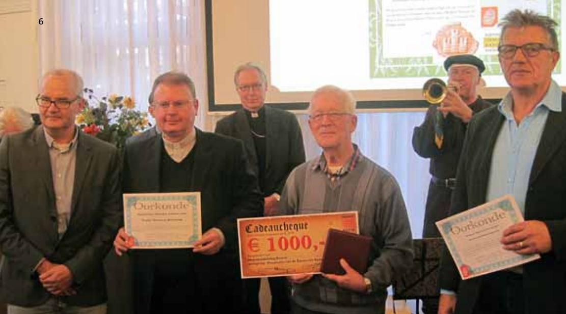
De drie winnaars, rechts Kruisweg Haarsteeg, in het midden de Petrusbasiliek Boxtel en links de Kruisweg Haarsteeg.