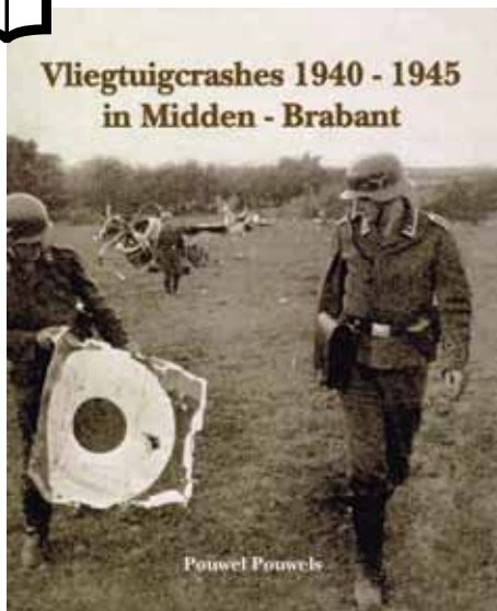
► Het levenswerk van Pouwel Pouwels, gefascineerd door de luchtoorlog.