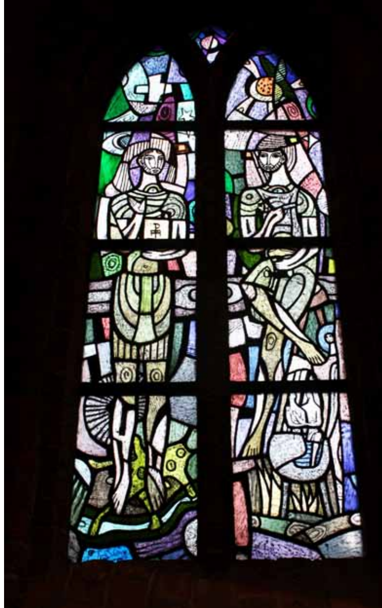
De gebrandschilderde ramen in de kerk van Moergestel met links Crispinus en rechts Crispinianus.

Gebrandschilderde ramen in de kerk van Moergestel met links Crispinus en rechts Crispinianus. Zij waren broers die tijdens een christenvervolging in de Romeinse tijd naar Gallië (Frankrijk) uitweken. Daar vestigden zij zich als schoenmaker en werkten