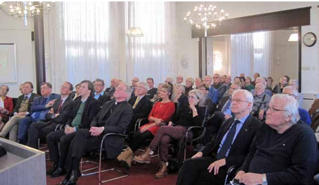
➤ Een volle zaal in het oude Raadhuis van Oisterwijk luistert naar de presentatie van de genomineerden.

Onder klaoengeschal van de muzikanten van de Elkerlyc Speellieden werd Boxtel als winnaar aangewezen, goed voor een oorkonde, een penning van de stichting en een geldcheque van 1000 euro van Brabants Heem. De andere twee genomineerden ontvingen een oorkonde en een cheque van 500 euro van Erfgoed Brabant.