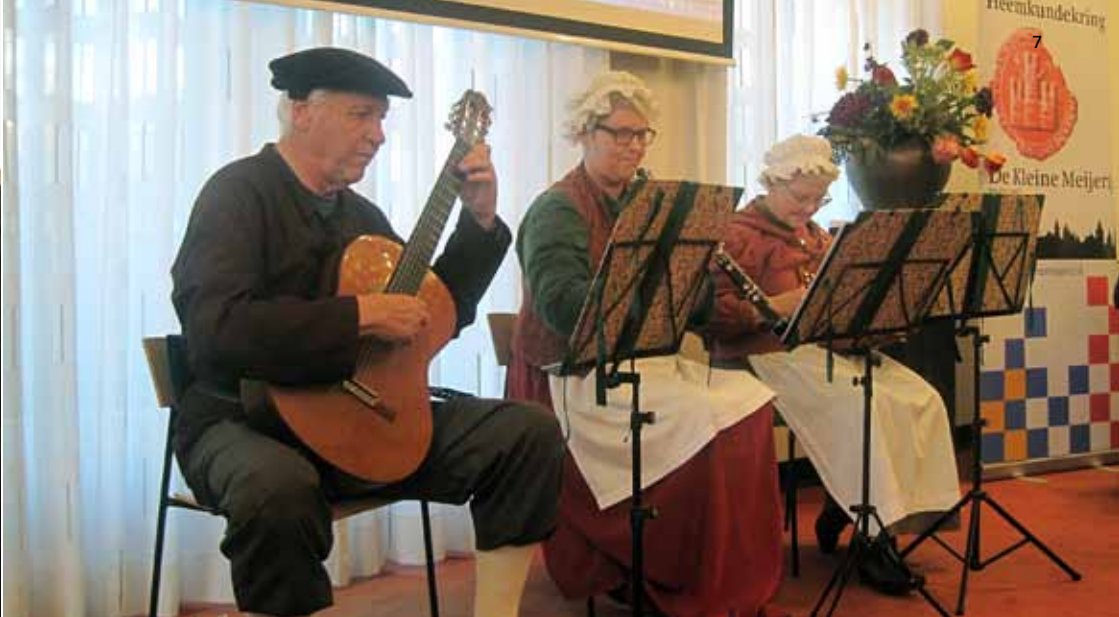
Volksmuziek als intermezzo van de Elkerlyc Speellieden.

de initiatiefnemers die met hun enthousiasme en idealisme uiteindelijk met minimale middelen een breed gedragen project hebben gerealiseerd.