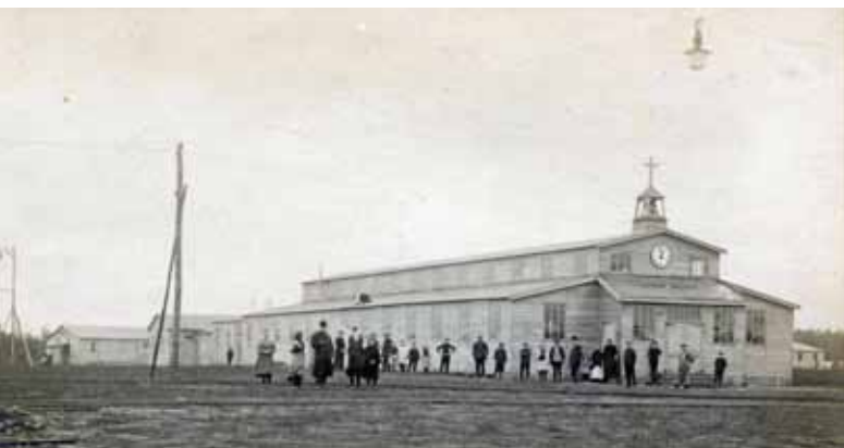
◀ De r.k. kerk van Vluchtoord Uden.

Ook dit keer is de schrijver erin geslaagd een rijk geïllustreerd boek van 192 bladzijdes samen te stellen. Een heel team assisteerde hem daarbij. Vrijwilligers van de Werkgroep 100 jaar Vluchtoord van de Heemkundekring Uden deden o.a. onderzoekswerk in archieven en kranten om de auteur bij het schrijven te ondersteunen.