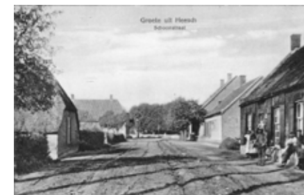
De Schoonstraat in Heesch, verbinding tussen Hoogstraat en Rijksweg.